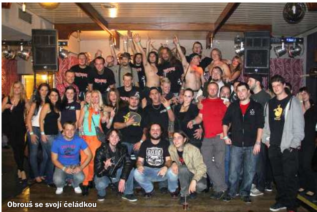
Obrouš se svojí čeládkou