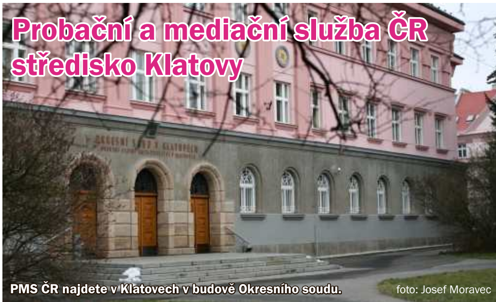
PMS ČR najdete v Klatovech v budově Okresního soudu.