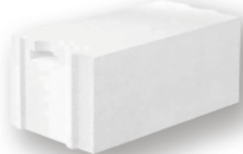
Pórobetonová tvárnice YTONG