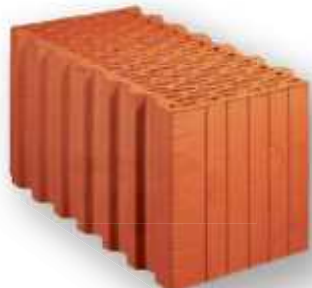
Cihelná tvárnice na maltu 440 PD 247x440x238

TOHLE tu ještě NEBYLO nejvýhodnější nabídka ROKU