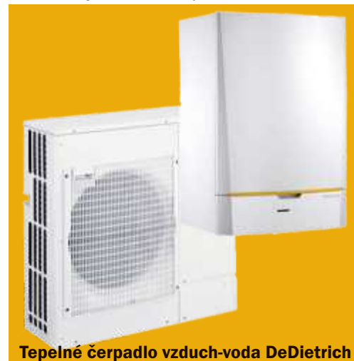
Tepelné čerpadlo vzduch-voda DeDietrich

i 3,5 hod. intenzivní práce. Za 10 minut lze jen velmi zběžně a neodborně posoudit stav kotle, žádný z povinných úkolů se za tak krátký čas nedá provést! Pokud vám servisní firma provádí tento „rychlouservis“, nechte si doložit a potvrdit servisní úkony, které výrobce požaduje a bývají nedílnou součástí manuálu, jde o vaši bezpečnost!