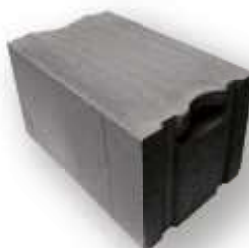
Pórobetonová tvárnice šedá PORFIX PDK 500x250x375

Při objednávce materiálu na kompletní stavbu, poskytujeme jako poděkování navíc slevové poukazy na dveře a zárubně, plovoucí podlahy, výrobu kuchyňských linek, vestavných skříní a jakéhokoliv nábytku dle vlastního výběru od naší divize výroby nábytku TRACOR WOOD , kalkulace a zaměření zdarma, cenové nabídky a 3D návrhy zdarma.