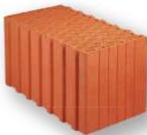
Cihelná tvárnice broušená 440 PD 247x440x249